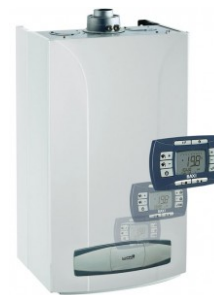
LUNA-3 Comfort 1.240Fi