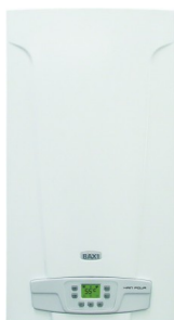
ECO Four 1.14