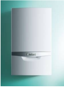
Настенный конденсационный одноконтурный котел esotec plus VU INT IV 306/5-5 H