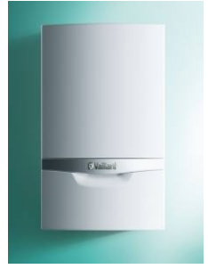
Настенный конденсационный двухконтурный котел esotec plus VUW INT IV 246/5-5 H