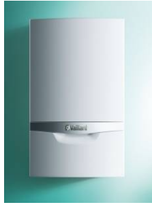
Настенный конденсационный двухконтурный котел esotec plus VUW INT IV 346/5-5 H